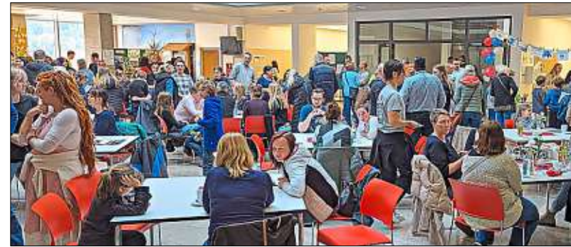
Am Tag der offenen Tür herrschte an der Realschule Grafenau ein Riesenandrang.

Das Fach Geographie zeigte Experimente zum Thema „Vulkane“ und dabei auch das im Geographie-Fachraum installierte Smartboard. Chemische Experimente, welche die zukünftigen Schüler teilweise selbst durchführen durften, bereiteten manch zischende und brodelnde Überraschung. Das Fach IT führte den 3D-Drucker und Objekte, die sich damit drucken lassen, vor, techni-