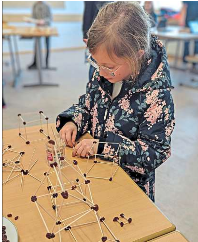
So macht Mathe Spaß: Würfel bauen mit Zahnstocher und Rosinen.

Währenddessen hatten die zukünftigen Schüler die Gelegenheit, an Führungen zu verschiedenen Mitmach- und Experimentierstationen teilzunehmen.