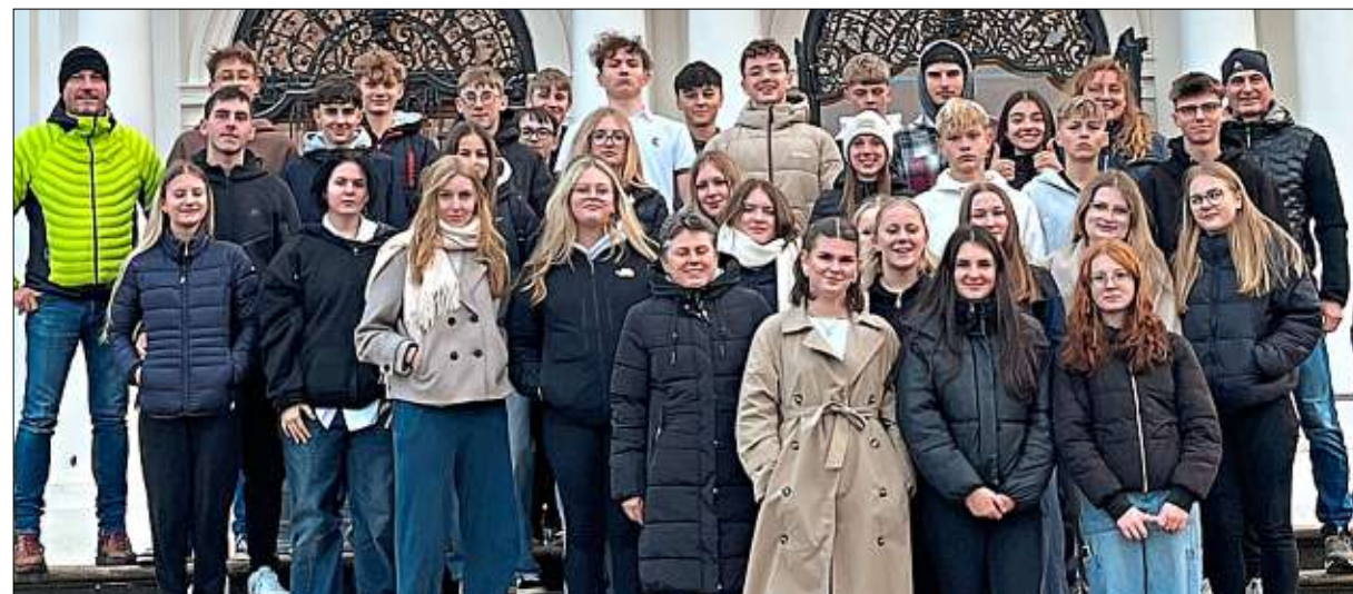
Eindrucksvolle Momente genossen die Grafenauer Realschüler der Klassen 10b und 10c bei ihrer Abschlussfahrt in der österreichischen Hauptstadt.

Anzeigen-Preisliste Nr. 69 vom 1. Januar 2025. Die Zeitungen der Passauer Neue Presse GmbH nehmen an der Mediaanalyse teil. Verbreitete Gesamtauflage (IVW) III. Quartal 2025: PNP gesamt 129 942 (incl. ePaper) und 111 606 (ohne ePaper). Gedruckt auf Recycling-Papier mit mindestens 75 Prozent Altpapier-Anteil.